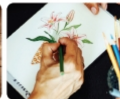
쉽게 따라하는 컬러링 북