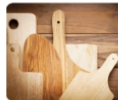
손수 만드는 소가구