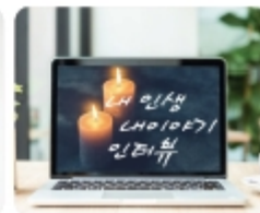
내 인생 내 이야기 (동영상 제작)